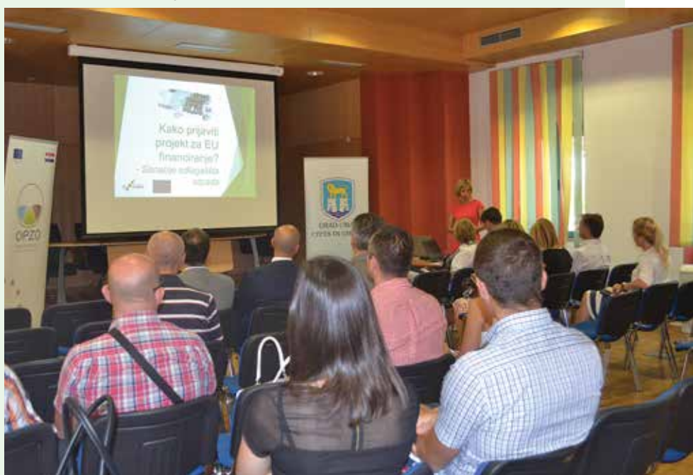
Radionica FZOEU-a o sanaciji odlagališta novcem EU: Umag kao primjer Laboratorio organizzato dal Fondo per la tutela dell'ambiente e l'efficienza energetica sulla bonifica della discarica: Umago-città modello

one dei gas nocivi e dei loro effetti sulla qualità dell'acqua e della terra, il che appporterà numerosi benefici all'ambiente e alla salute degli abitanti. Grazie al progetto "Umago: Smart City-Green City 2010-2020", la Città di Umago vuole offrire a tutti i suoi concittadini un ambiente sano, moderno ed eco-compatibile.