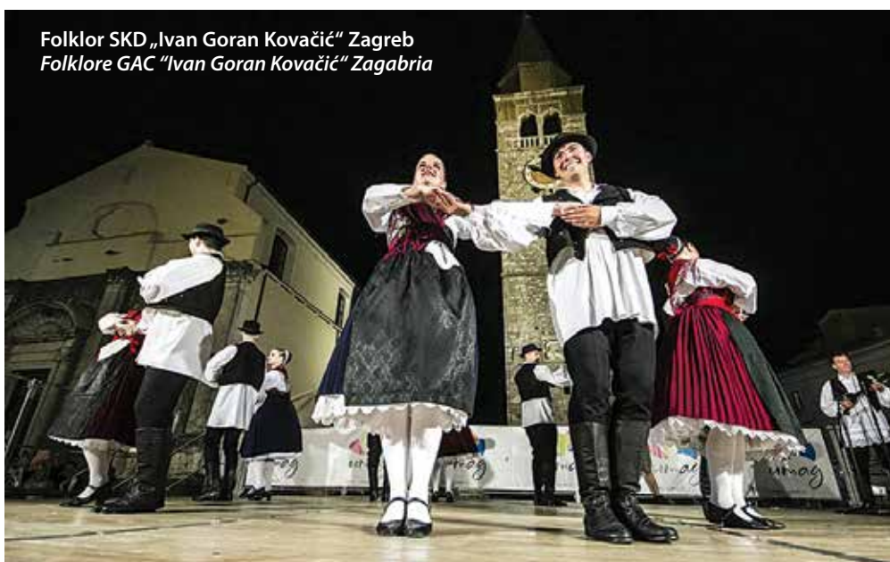
Folklor SKD „Ivan Goran Kovačić“ Zagreb Folklore GAC „Ivan Goran Kovačić“ Zagabria