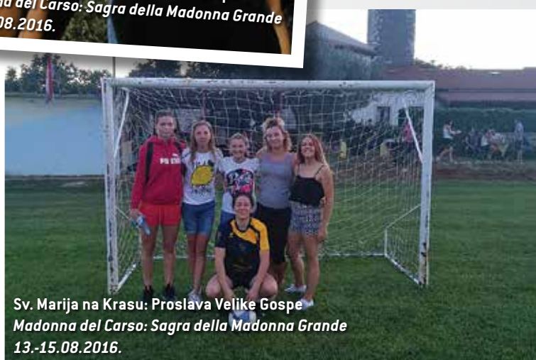
Sv. Marija na Krasu: Proslava Velike Gospe Madonna del Carso: Sagra della Madonna Grande 13.-15.08.2016.