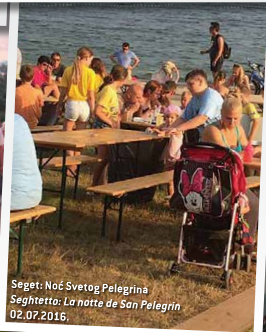
Seget: Noć Svetog Pelegrina Seghtetto: La notte de San Pelegrin 02.07.2016.