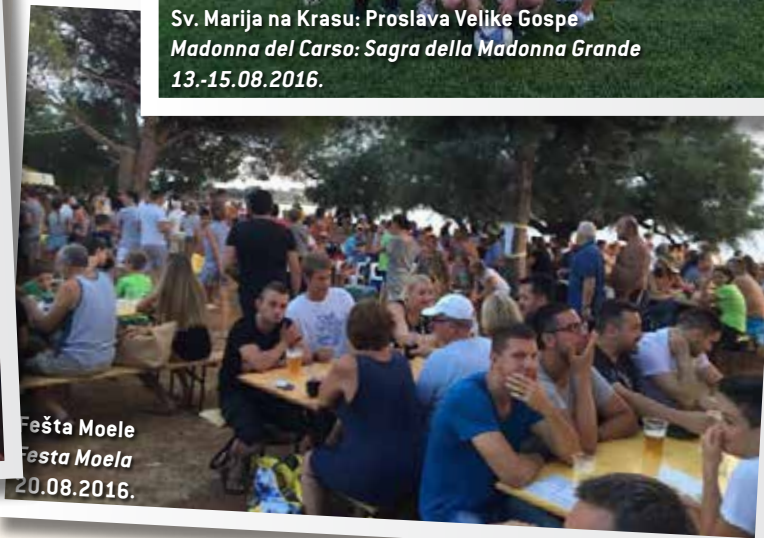
Fešta Moele Festa Moela 20.08.2016.