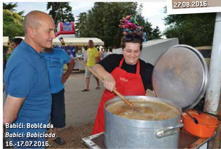
Babići: Bobićada Babići: Bobićada 16.-17.07.2016.