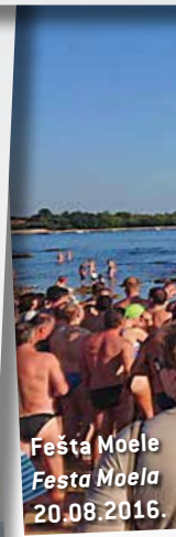
Fešta Moele Festa Maela 20.08.2016.