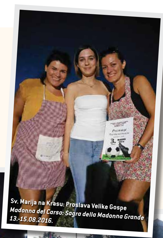
Sv. Marija na Krasu: Proslava Velike Gospe Madonna del Carso: Sagra della Madonna Grande 13.-15.08.2016.