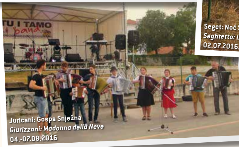
Juricani: Gospa Snježna Giurizzani: Madonna della Neve 04.-07.08.2016