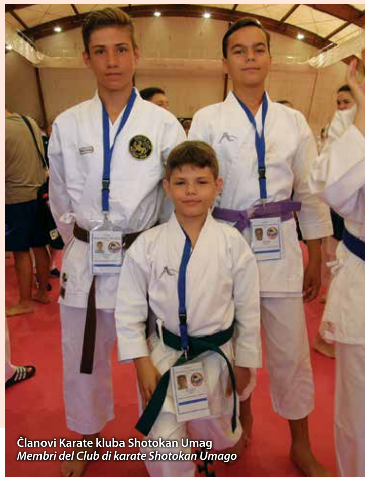
Članovi Karate kluba Shotokan Umag Membri del Club di karate Shotokan Umago