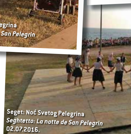
Seget: Noć Svetog Pelegrina Seghtetto: La notte de San Pelegrin 02.07.2016.