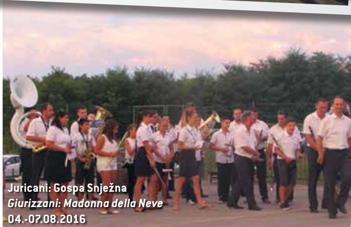
Juricani: Gospa Snježna Giurizzani: Madonna della Neve 04.-07.08.2016